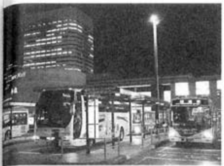
海浜幕張駅前から出発する京成バス

江ノ電高速バス「鎌倉・藤沢」京都・なんば・堺線」は戸塚駅を21時に出発(南海バスと共同運行)し、鎌倉駅、藤沢駅などからも乗車できる。京都駅5時24分、南海なんば高速バスターミナル6時44分着。戸塚・なんば間は片道8100円。