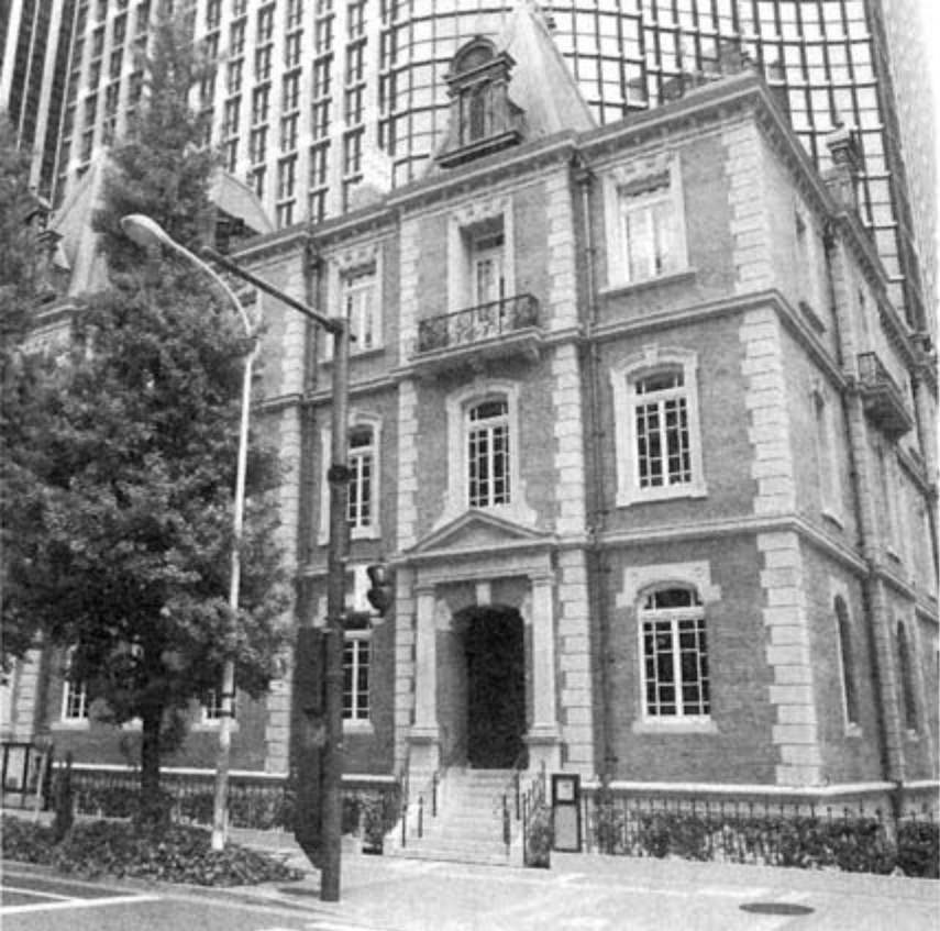
明治時代のレンガ造りを復元した三菱一号館。 4月には美術館もオープンした