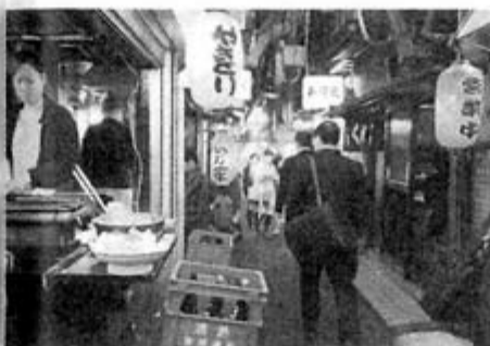
狭い路地に飲み屋がひしめく思い出横丁

ブルメリアを始め大都市間を結ぶツアーバスを運行する平成エンタープライズは6月下旬、降車地・エルタワー前から徒歩3分の場所に、バス利用客が使えるVIPラウンジをオープンさせる。化粧直しができるパウダールーム、ホットコーヒーと冷たいお茶を用意するドリンクバー、それに、インターネット用のパソコンがある。手荷物も預かる。これらのサービスはすべて無料だ。5時～9時、20時～23時45分の営業で、日中は営業しない。 今回は、新宿に到着後に、すぐそばのホテルロースガーデンで腹ごしらえをした。オムレツなど和洋28品が並ぶ朝食ビュッフェは通常1500円だが、バスの予約時にオプションで申し込むと900円となる。 入浴したければ、降車地から歩いて10分のカプセルホテル、グリーンプラザ新宿へ。男性専用の風呂・サウナと、女性専用のスパ施設「リ・ラックスパ」がある。