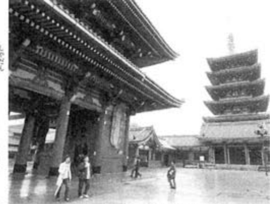
浅草寺の宝蔵門と五重塔

大黒家11時～20時30分、土曜、祝日11時～21時/無休/☎03・3844・1111 江戸下町工芸館10時～20時/無休/無料/☎03・3842・1990 テブコ浅草館10時～18時/月曜休(祝日の場合は翌日休)/無料/☎03・5827・3800 新宿センタービル展望スペース8時～23時/無休/無料/☎03・3344・5671