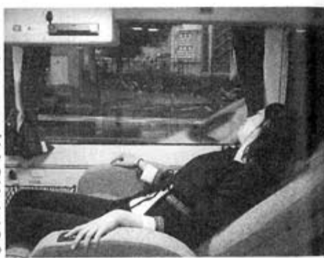
ウィラートラベルのバスはゆったりしたシートも用意

日本中央バスは、大阪から京都、名古屋、金沢を經由し、群馬県の高崎、前橋へバスを運行している。なんば・前橋駅間で