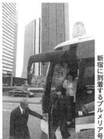
新宿に到着するブルメリア号

安い上に快適なため、人気を集める高速ツアーバスも多い。ウィラートラベルもその1社で、東京、大阪、名古屋など、75都市を毎日150便が結んでいる。車両タイプの種類が豊富で、独立3列シートで女性専用の「プリマ」、各シートに映画を流しめるモニターを装備する「シアター」などが人気だ。シアターは東京・仙台、名古屋間と、大阪・名古屋間(52円参照)で